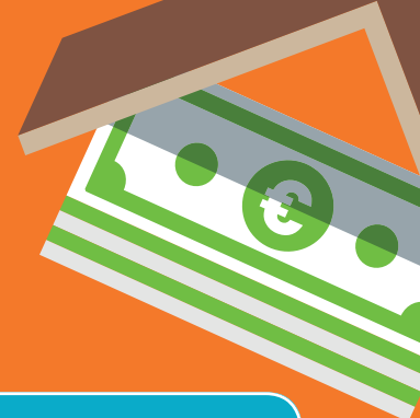
TABLEAU DES PRIMES

Montants des primes (selon la catégorie de revenus du ménage) actualisés au 1er mars 2018 et applicables à toute demande réceptionnée à partir de cette date